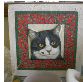
壁飾りアート (20x20cm) ¥1,200 (材料費込)