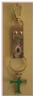
キーホルダー ¥900 (材料費込み)