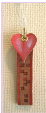
携帯ストラップ ¥500 (材料費込み)