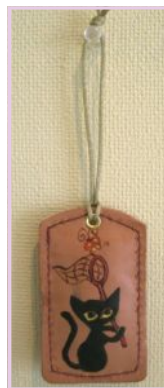
ネームタグ ¥1,200 (材料費込み)