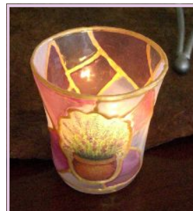
創作キャンドルスタンド ¥1,000 (材料費込み)